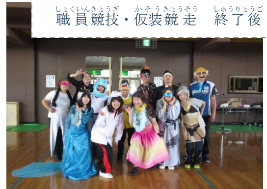
しよくいんきようぎ かそうきようそう しゅうりようご 職員競技・仮装競走 終了後