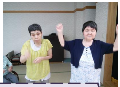
好きな曲をいっぱい歌い、踊りました♪