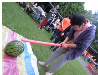
すいかわ スイカ割りもしました