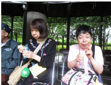
えんにち よーよー げっと 縁日でヨーヨーをゲット

6月24、25日に足寄町で開催された「平成29年度道東みどり会」に参加してきました。今年の内容は、みどり会では初となるキャンプを行い、外で焼き肉をしたり縁日やスイカ割りに参加、カレー作りをしたりと、苑ではあまり経験ができないことを体験してきました。貴重な体験ができた2日間となり、参加された2名の利用者さんは疲れもみられていましたが楽しまれていた様子でした。