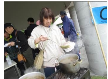
かめ かれーづくり 2日目はカレー作り