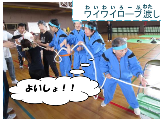
ワイワイロープ渡し