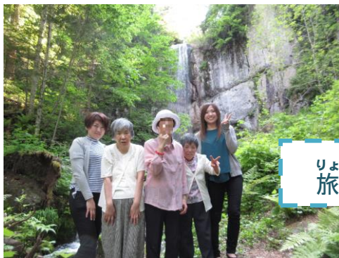
りょこう い 旅行へ行ったり♪