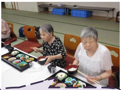
豪華なお弁当でした☆