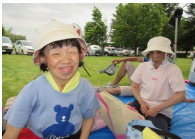
ひさぶりのさんか うれ ようす 久しぶりの参加で嬉しい様子

7月1日に紋別市上渚滑で開催された網走管内パークゴルフ大会に参加してきました。あいにくの天気、予選ラウンド2コースだけで終了となってしまいましたが、みなさん一生懸命頑張られていました。昨年は収穫祭と日にちが重なってしまい、2年ぶりの参加となり「やっといける」と、参加出来る事とても楽しみにされていました。