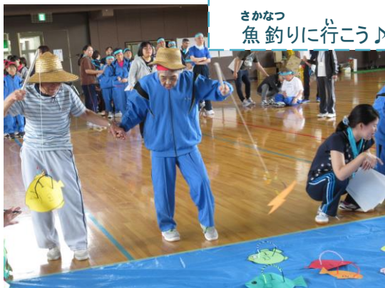
さかなつ 魚釣りに行こう♪

他にも、「ワイワイロープ渡し」、「玉入れ」を行い、最後にみんなで輪になりフォークダンスを踊りました。光星苑の利用者の方とも交流ができ、とても楽しいひと時を過ごし、皆さん喜ばれていました。