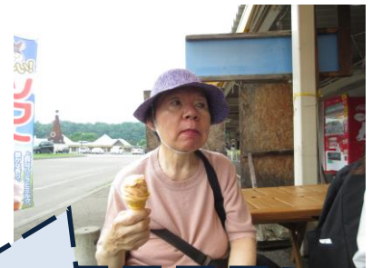
果夢林でソフトクリーム！