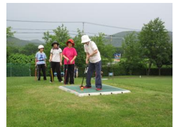
ぱーくごる ふふうけい パークゴルフ風景