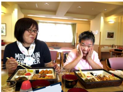
美味しいお弁当も食べたよ♪