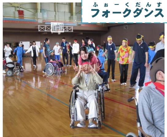
ふおーくだんす フォークダンス