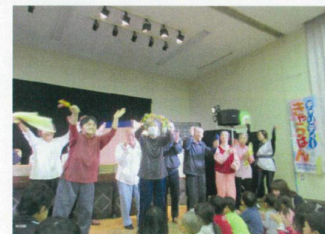
一緒に踊りました