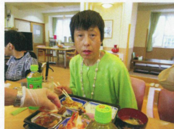
べんとうおい お弁当美味しかったよ♪