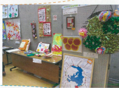
さくひん しゅってん 作品の出展もしました。