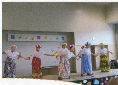
おど はっぴょう 踊りの発表をしました♪