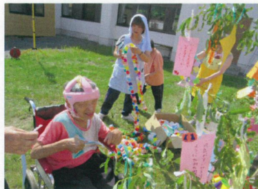
かぎ 飾りつけてます