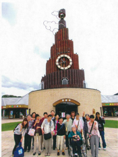
はとどけい まえ はい ちーず 鳩時計の前でハイ・チーズ！

各棟ごとに、山の水族館に出かけました。大きな魚や小さな魚に会い、 ドクターフィッシュも体験しました！たくさんのお魚を見た後は・・・お待ちかねの昼食！ 今年は地元・温根湯のお店で頼んだ「豪華なお弁当を食べました～！」