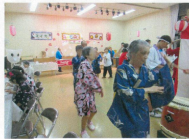
じょうず おど 上手に踊ってます