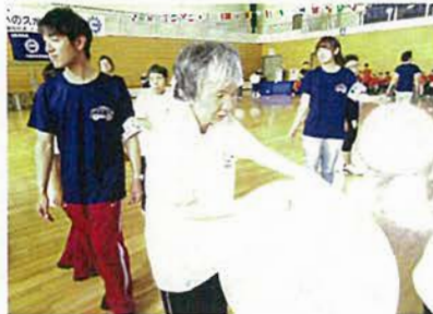
相手コートめがけて