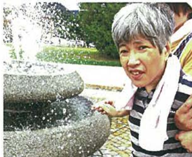
噴水に行きました