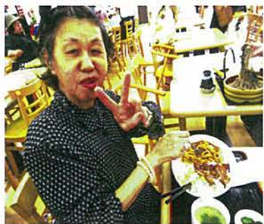
ご飯も楽しみのひとつ