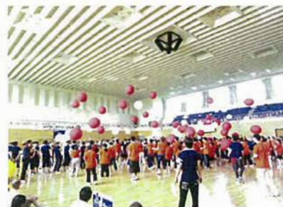
風船バレーの様子