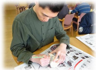
真剣に作っています…！