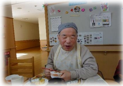
生ちらしとっても美味しい(^^♪