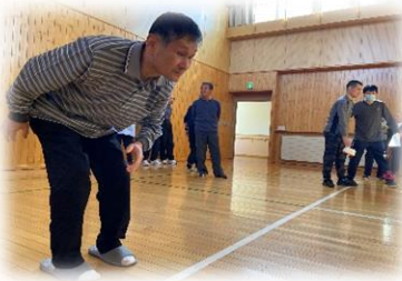
カーリング楽しいね♪