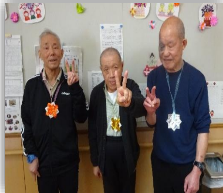
↑カーリングの表彰です！↑