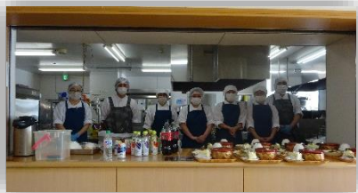
4月から厨房の調理員の業者が新たに富士産業さんになりました！ 調理員さんが変わっても今までと変わらない美味しい料理を皆さんに提供してくれています！