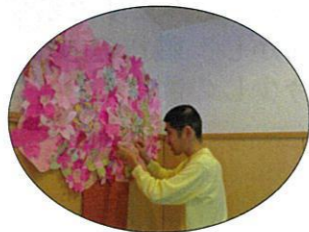
作った桜を貼り付けて～