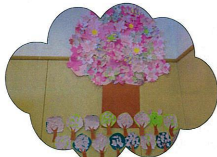
桜の木が完成しました(´0´)