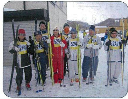
みんなで頑張ります(^_^)