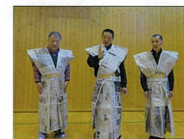
年男の皆さんです♪