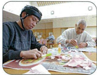
桜の花を作ってまーす♪

3月31日、本館食堂にて創作活動を行いました。 桜の花びらを1枚ずつ型どりし、切ったり貼ったりと皆さん集中して製作され、満開の桜の木が出来上がり、沢山の笑顔も咲きました。