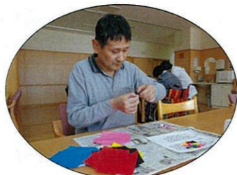
真剣に取り組んでいます♪