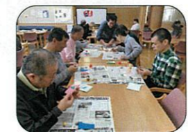
真剣に取り組中です♪

人形を操る職員と朗読の職員の息がぴったりと合い、見ている利用者さんも笑ったり、驚いたりとても楽しまれていました。