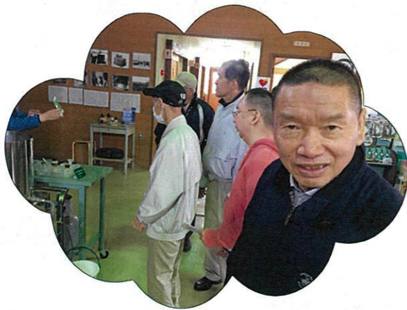
グループ外出の様子です^o^