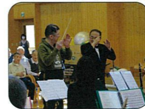
一緒に指揮をしています!