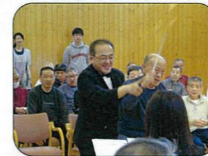
教えてもらってます(^_^)