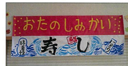
楽しみにしていたお寿司ですよー♪

2月7日、誕生会を兼ねたお楽しみ会を行いました。今回は、昨年11月に、皆さんから大好評だった北見名物「トリトン」の生寿司と光星苑の調理さん手作りのから揚げとデザートでお祝いしました。利用者さんからは「生寿司をたくさん食べて、お腹いっぱい、美味しかったよ」との声も多く聞かれ、今回も大好評でした。