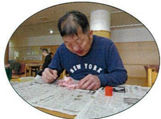
沢山作ってください(´)

3月31日、本館食堂にて創作活動を行いました。 桜の花びらを1枚ずつ型どりし、切ったり貼ったりと皆さん集中して製作され、満開の桜の木が出来上がり、沢山の笑顔も咲きました。