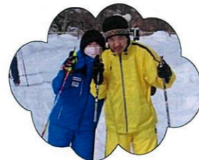
仲良くハイチーズ(^_^)