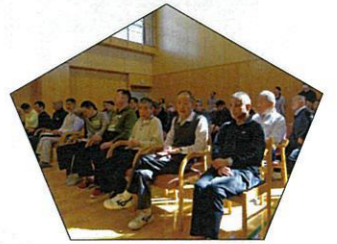
集中して聞いてます☆