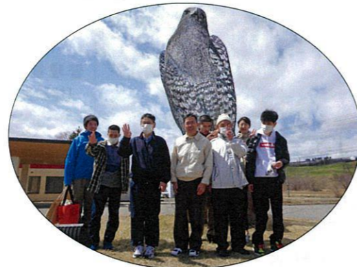
映画を 見てきました☆