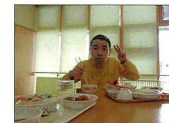
早く食べたいですね♪