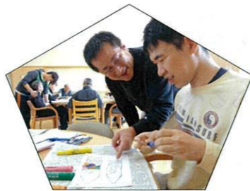
笑顔で作ってますね(´)

皆さん、真剣に取り組んでいて、笑顔で色を決めて貼ったりと最後まで楽しまれていました。