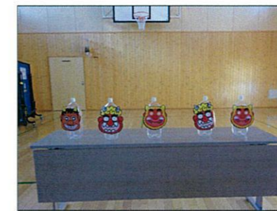
鬼のお面がついた的ですよー！