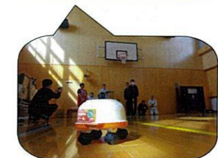
特製オリジナルストーン!