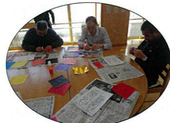
完成が楽しみです(´)