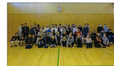
みんなでハイチーズ(*^^)v