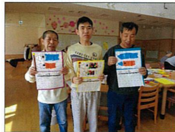
カレンダー完成しました(´)