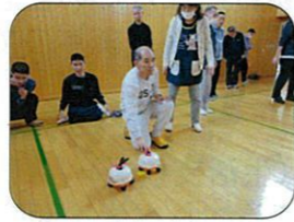
ポーズが かっこいいですね☆