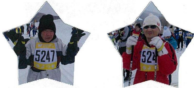
最後まで頑張ってください(^_^)

2月26日、遠軽町で湧別原野オホーツククロスカントリースキー大会が行われました。光星苑からは6名の利用者さんが5キロコースに参加しました。当日は、風が強く、雪も降ることがありましたが、見事に完走しました。例年に比べ天候が悪かった為か、ゴール後は皆さん疲れていた様子でした。