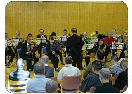
素敵な音楽ですね♪