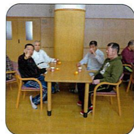
甘酒とみかん いいですね(^_^)