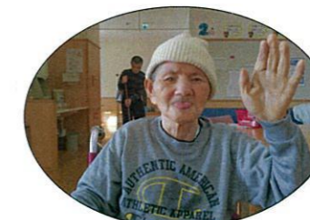
笑顔がステキですね(^_^)