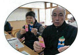
上手にできました☆