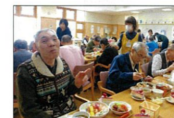
美味しそうですね(*^^*)