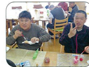
完成が楽しみです(^_^)