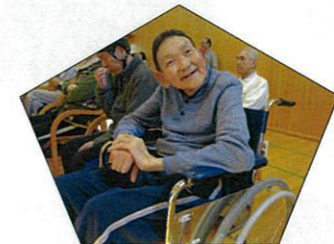
笑顔がステキですね(^_^)