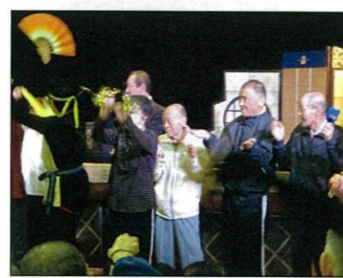
一緒に参加しちゃいました♪