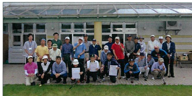
アジャタ大会 頑張りました(*^^*)