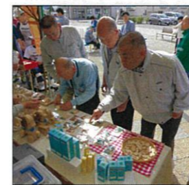
何を買おうかな・・・