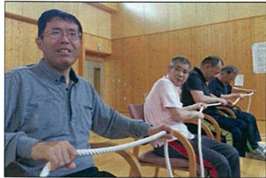
引っ張れ引っ張れ～

5月27日、お花見会が行われました。当日は少量の雨も降っていましたが競技前には天候も良くなりパークゴルフ大会を行いました。パークゴルフではホールインワン賞を取り利用者さんの笑顔も見られていました。ミニゲームでは、ワイワイロープ渡しとボール送りと初めてのゲームで途中ハプニングもありましたが皆さん楽しまれていました。昼食はジンギスカンをテラス前で行ない「美味しいね、また食べたいね」と話されて楽しいひとときを過ごしました。