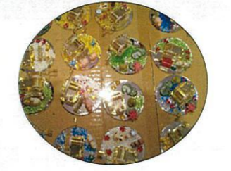
オルゴール作りました♪