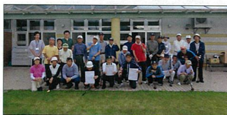
楽しかったですか？