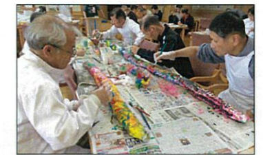
長い布に色を塗って何が出来るかな？