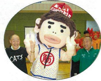
カニチョコッ筋マンと一緒にハイチーズ！！