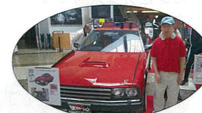
カッコいい車です★