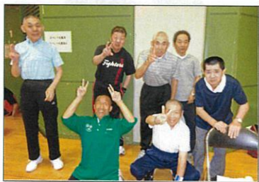
皆で協力して頑張るぞー！