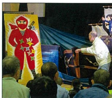
手裏剣！！ 上手に刺さるかな？