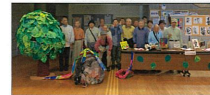
大きな木と長い蛇と皆と一緒に記念撮影(^_^)v