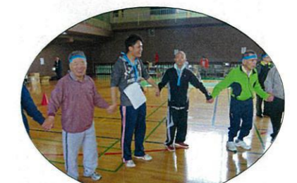
仲良くマイムマイム♪