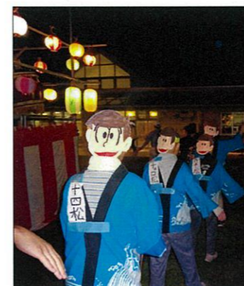
みごとな仮装です♪

8月10日、恒例の納涼盆踊りを光星苑の広場で行ないました。前日に雨が降り、当日の天気も心配していましたが、天気も良く、地域の方たちも多く集まっていたので、大変な賑わいぶりでした。子供会の皆さんによる威勢のよい太鼓の音に合わせて、櫓の周りには踊りの輪が広がりました。露店では、ビールや焼き鳥、たこ焼きなどに舌鼓を打ちながら夏のひとときを楽しみました。