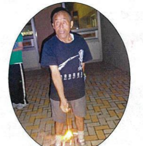
もっと花火したいなあ★