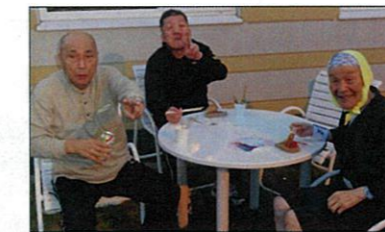
ステキな笑顔ですね！