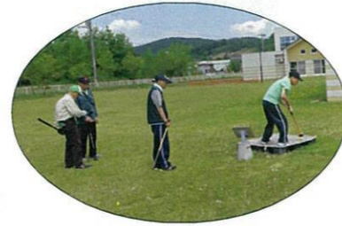
目指せ！ホールインワン！