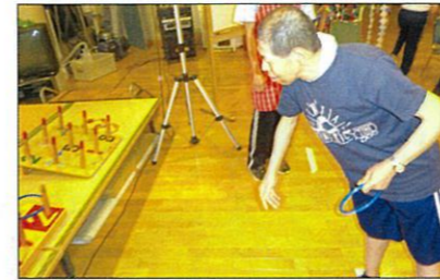
輪投げは楽しいです♪

8月5日、静楽園にて七夕まつりが行われて、光星苑の皆さんも招待されました。たくさんのおいしい食べ物を食べた後は、楽しいゲームに挑戦し景品をもらい、抽選会では2等に当たった利用者さんもいました。最後には、花火を楽しむこともでき、思い出に残る一夜になりました。