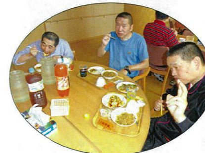
ゆっくり食べてね★

7月15日、お誕生会を兼ねてのお楽しみ会が行われました。いつものバイキングとは違った形態で、今回のお楽しみ会は、なんと施設長と職員で焼いたお好み焼き、焼きそばパーティでした。デザートにはスイカ、ケーキも盛りだくさんで、利用者の方は美味しく、楽しく頂きました。