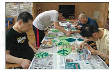
大きな葉っぱも何が出来るかな？

自分たちが作った作品が展示されているのを見て「頑張って作ったやつだよ」など嬉しそうに話をしていました。