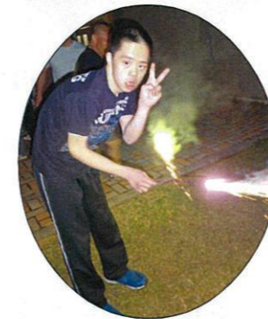
花火持ちながらピース♪