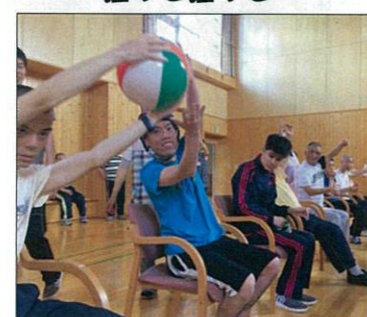
おとと落ちる落ちる(汗)