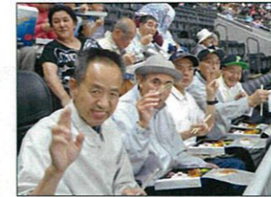
札幌ドームで観戦中！

6月9日から11日の2泊3日で札幌旅行に行きました。今回の旅行は、札幌ドームでの日本ハム対広島カープの観戦と、小樽では石原裕次郎記念館へ行ったり、オルゴール作りやとんぼ玉作りにも挑戦しました。ダイナミックな炭火焼きもお腹いっぱい食べたりと、とても楽しく充実した3日間でした。