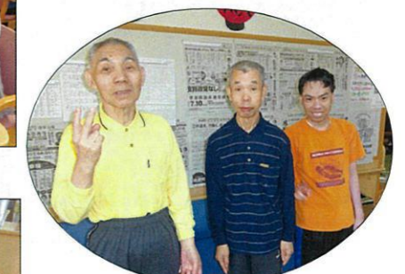
今月誕生日でした♪