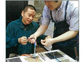
とんぼ玉作りに挑戦中！！