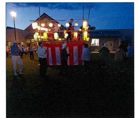
盆踊りステキですね★