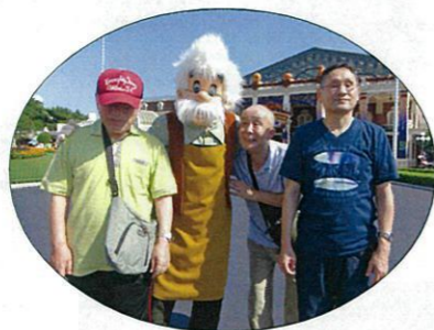
ディズニーキャラクターと記念撮影！！