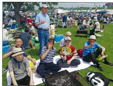
和牛祭り！！ お肉美味しかったです♪

7月17日から18日、美幌和牛まつりをメインに9名の皆さんが参加されました。当日は、暑過ぎる程天気も良く、和牛まつりの会場も大勢の人でにぎわっていました。「美幌和牛」は、口の中に入れると柔らかくとってもジューシーなお肉で皆さん大変満足されていました。その後、美幌峠経由で砂湯を観光し屈斜路湖の温泉で一泊しました。翌日はリニューアルしてから初めて「網走監獄」を見学してきました。砂湯や網走監獄など昔行ったことがある場所ではありましたが、「懐かしいね〜」など感想も聞かれた旅行になり皆さん喜ばれていました。