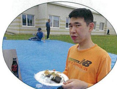
美味しそうですね(^o^)