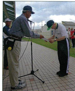
おめでとうございます♪