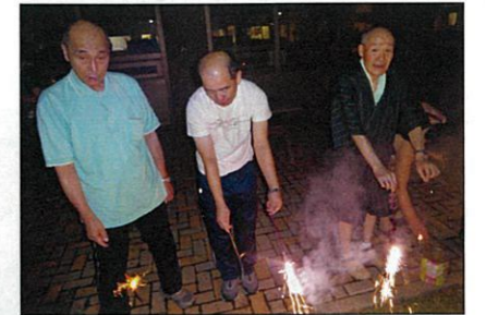
仲よく花火☆キレイですね