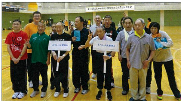
ライオンズクラブ福祉 パークゴルフ交流会 楽しかったです☆彡