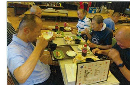
焼き鳥、焼きそばなど 美味しいですか？