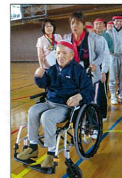
いちについて、 ヨーイ！！

お昼においしいお弁当を食べた後は、仲良く手を取り合って恒例のマイムマイムを楽しく踊りました。どのチームもいい汗をかかれています。