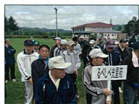
緊張で胸がドキドキ♪