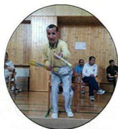
ダンボールに入っ〜!!

5月29日にお花見会が行われました。当日は天気にも恵まれ、予定通りパークゴルフと室内ゲームに分かれてみなさんお大いに盛り上がっていました。昼食は楽しみにされていたジンギスカンをテラス前で行ない、暖かい日差しの中楽しいひとときを過ごしました。