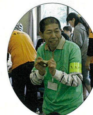
スタッフとして お手伝いして頂きました