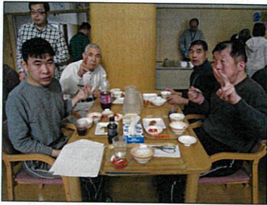
バイキングはどれもおいしいです