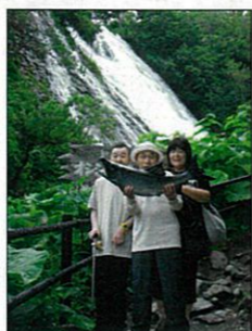
オシンコシンの滝とシャケ(^_^)