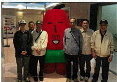
テレビ父さんと ハイ、チーズ☆

ミュージカルでは劇団四季の「キャッツ」を見て来ました。初めて観るミュージカルの迫力にみなさん驚いていましたが、終始笑顔で観覧しておりました。笑顔が多い3日間とても充実した旅行でした。