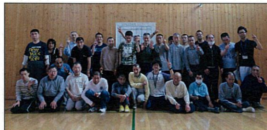
室内ゲームのみなさん大集合