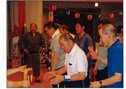
うまくできるかなあ?