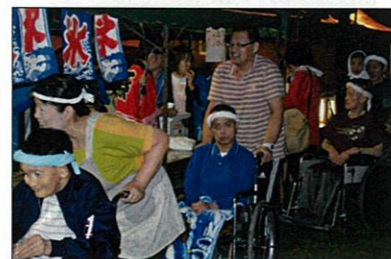
どれも美味しそうですね!