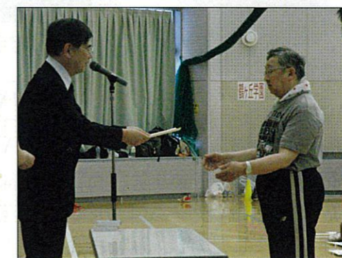
敢闘賞！！おめでとうございます～