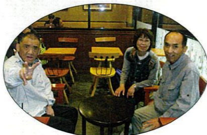
何を食べているかな〜?