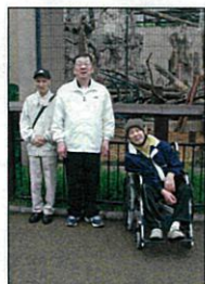
動物と一緒に パシャリ！！

6月23日から24日まで、旭川方面の旅行に出かけました。初日の旭山動物園では霧雨混じりの天候となりましたが、シロクマやオラウータンなどの動物を見て楽しみました。夕食は「銀座ライオン」ヘジンスカンを食べに行きましたが、ホテルへ戻る際に「おいしかったね」「また、食べに来たいね」と満足された様子でした。2日目は旭川市内で衣類や、CD、DVDなどの買い物を楽しみました。