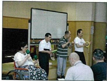
たくさん練習しました