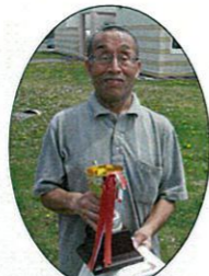
★優勝おめでとう ございます★