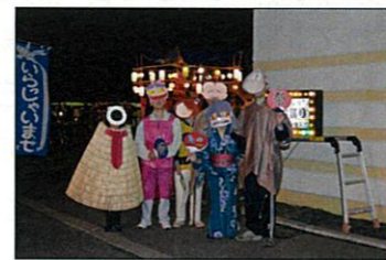
仮装しました!! 「ゲゲゲのきたろう」