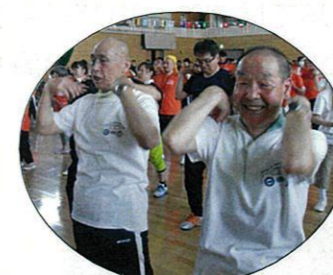
ケガをしないよう体操！！