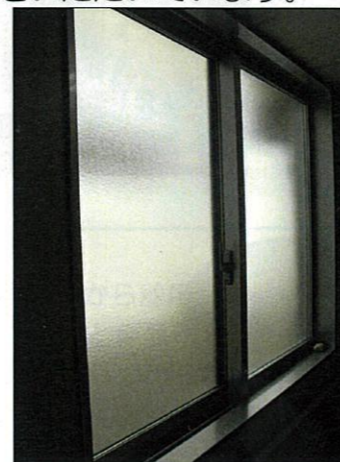
脱衣場の擦りガラス

家族会から食堂のエアコンを設置して頂きました。心地よい環境でおいしい食事をいただいています。