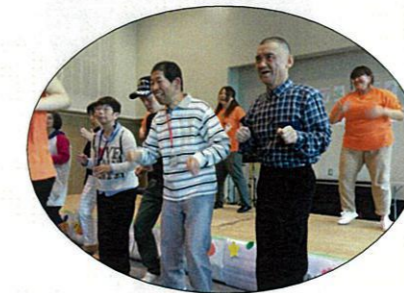
飛び入りで踊ってきました