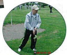
ナイス・ショット！！