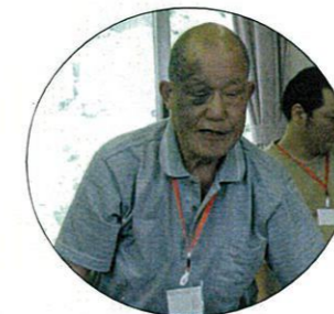
みんなと仲良く話そう♪