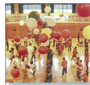
会場盛り上がってます！

7月14日、北海道立北見体育センターでナイスハートふれあいのスポーツ広場北見大会に18名の利用者さんが参加されました。各事業所から多数参加しており、人の多さに初めは驚いていましたが、競技が始まると他の事業所の方と力を合わせて楽しんでいました。勝った時は「やった～」と自然とハイタッチをして「次も頑張ろうね」と声を掛け合っていました。色々な方とふれあうことができ、みなさん大喜びでした。