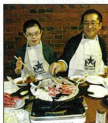
ジンギスカン美味し〜♪