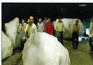
真夏の流水にビックリ！！

7月2日から3日と1泊2日で知床旅行に出かけました。1日目は、網走のオホーツク流水記念館で、季節外れの氷点下を体感したりオホーツク海の珍しい生き物を見たりしました。宿泊先の知床第一ホテルでは美味しいバイキング料理にみなさん大いに喜ばれていました。2日目は「オシンコシンの滝」や小清水町の菓子工場での見学をしてきました。