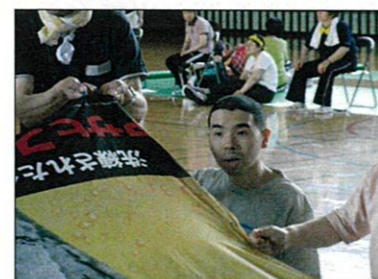
シーツバレー がんばるゾー!

お昼に美味しいお弁当を食べた後は、仲良く手を取り合って恒例のマイムマイムを楽しく踊りました。どのチームもいい汗をかかれています。