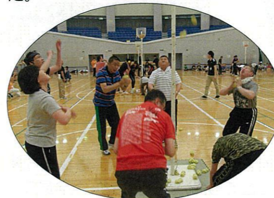
負けるな、頑張れー！！