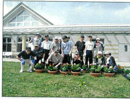
きれいに寄せ植えできました

5月29日、お花が好きな利用者の皆さんが花壇の花植えと各小舎前に置くプランターに好みの花を選んで寄せ植えをしました。水やりとお世話を皆さんで協力して行ない、少しでも長く咲くように心を込めて育てていきます。