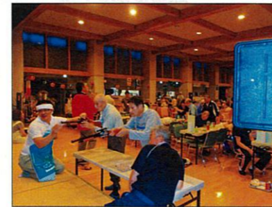
ねらって、ねらってー!!

帰り際、静楽園の方々から「また来年も来てね」と嬉しいお声を掛けて頂き、心もお腹もほっこりとさせて頂きました。ありがとうございました。