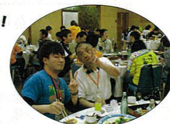
ご飯おいしいですか?