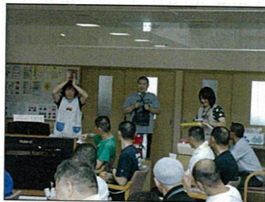
リズムに合わせて～♪

7月17日、生活介護を利用されている、地域で生活されている方と職員で昔なつかしい曲やサンバのリズムに合わせての演奏会を行ないました。数か月前から一生懸命練習に取り組み、本番では会場の利用者さんを目の前に素晴らしい演奏を披露してくれました。