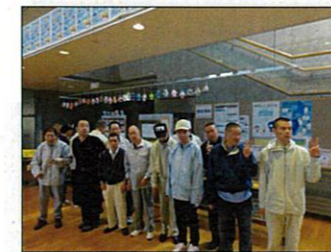
光星苑の作品の前でパシャリ

昨年も光星苑から作品を出していましたが、今年はそれを上回る数の作品を出しました。実際に自分たちの作品が展示されているのを見て「これ俺が作ったのだ!」と喜ばれている方や、他の事業所の作品を見て「すごいね～」と感動されている方もいらっしゃいました。参加されたみなさんは刺激を受けて「今度は違うものを作るぞ!」と意気込んで帰って来ていました。