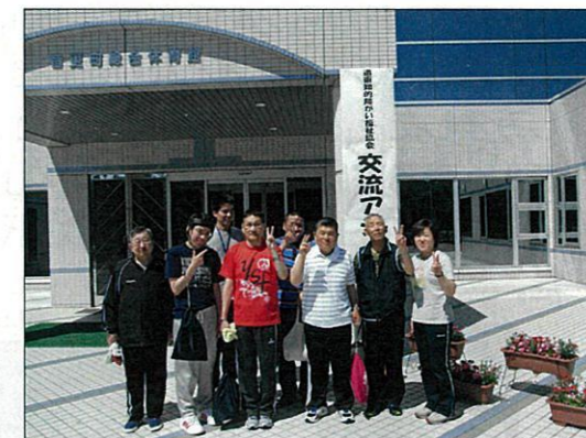
会場到着！！ さあがんばるぞ～

7月9日、音更町総合体育館で開かれた「第12回道東知的障がい福祉協会交流アジャタ大会」に6名の方が参加されました。今年の大会には道東各地から全23チームが集まり熱戦が繰り広げられました。光星苑チームは予選を全体の14位で通過し、今までの練習の成果が発揮されBリーグで4位に入賞しました。少し疲れも見られましたが、大会終了後にはすでに来年に向けた言葉も聞かれ、充実した一日になりました。