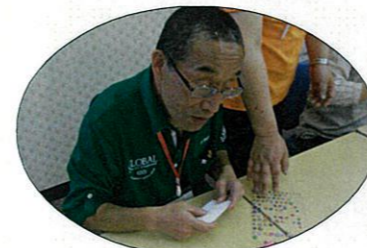
オリジナル名刺作り!

6月13日から14日の2日間、温根湯温泉「大江本家」で道東みどり会が行われました。道東各地の事業所を利用されているみなさんが一同に集まり、オリジナル名刺作りやレクリエーションなど行いました。今回のみどり会のテーマは「団結」で他の事業所のみなさんと協力して楽しまれておりました。交流会ではおいしい食事や、みんなで「ダンス」も踊り楽しい時間を過ごされていました。