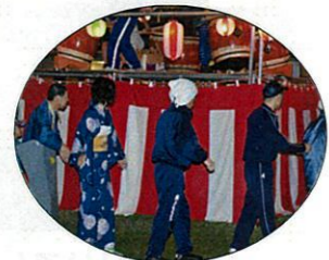
みんなで楽しく踊りましょう♪