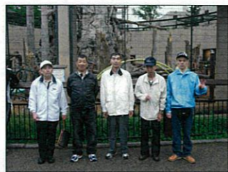
どの動物が好きですか～？