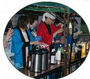
次は何飲みますか??

ボランティアで参加して頂きましたライオンズクラブの皆様、太鼓でお世話になりました子ども会の皆様ご協力ありがとうございました。