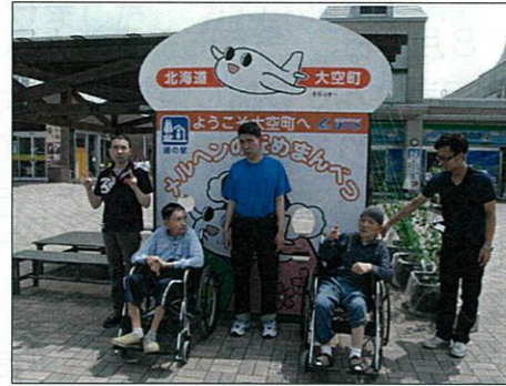
天気サイコー 旅行は楽しいね～

昼食は女満別の道の駅で特産物の豚肉を使用した料理を食べ「おいしい、おいしい」と言って満足されていました。帰苑の途中で食べたアイスクリームは暑さもあったせいか、格別においしく感じられ、みなさん素敵な笑顔に変身していました。